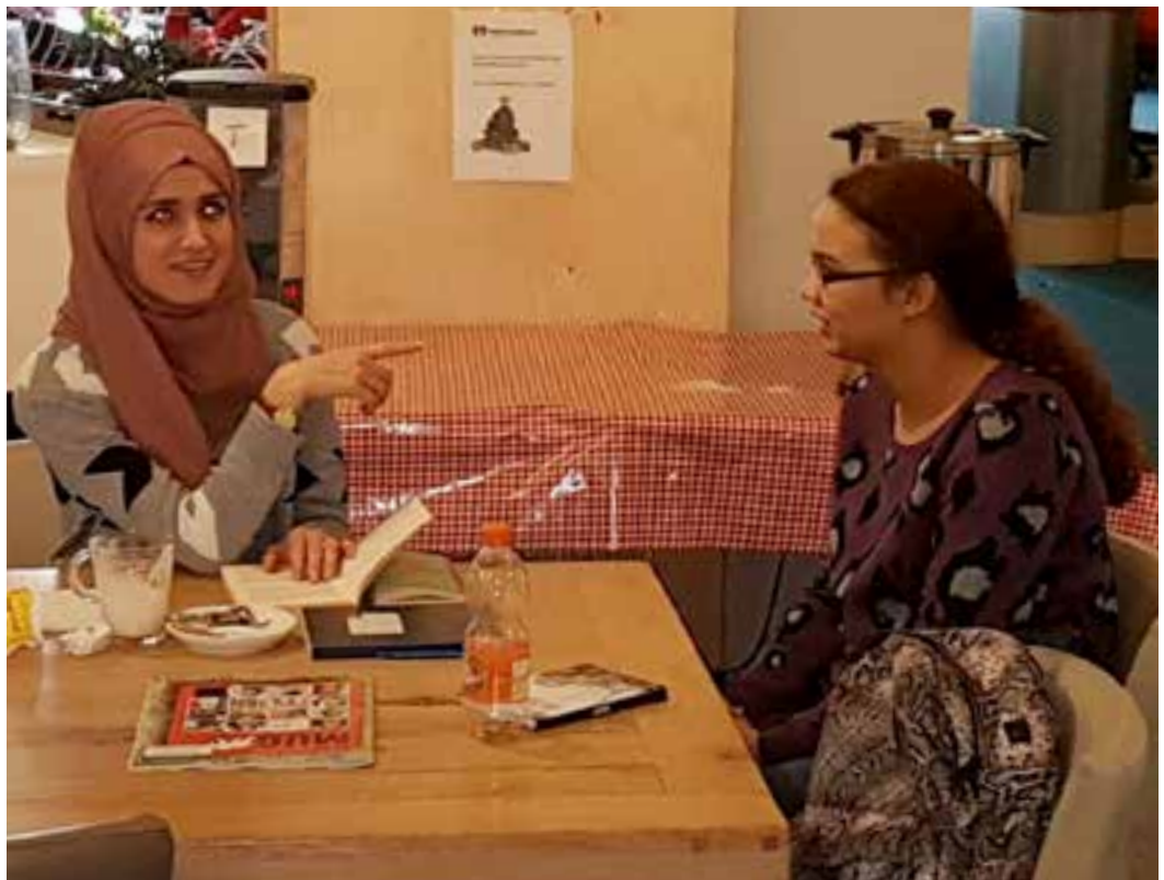
Leerwerkstages 'Eten in de Buurt'